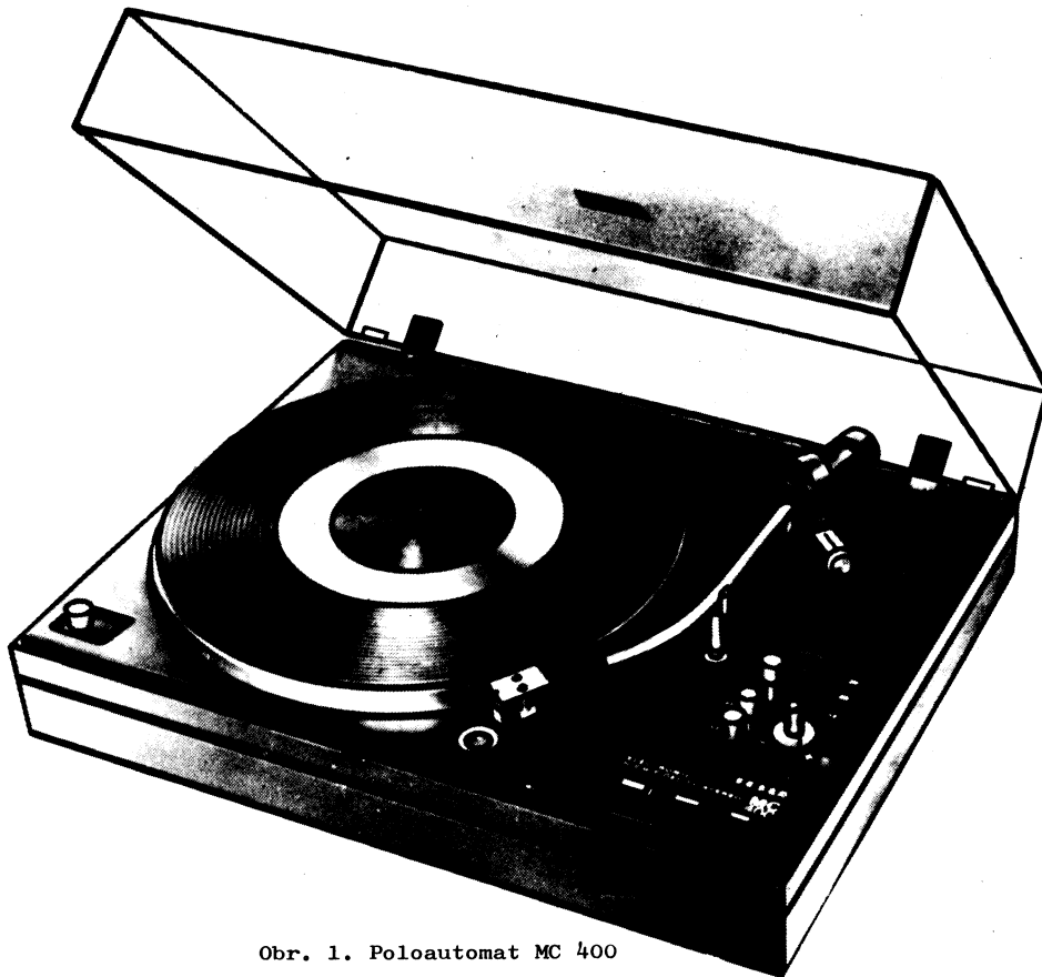
Obr. 1. Poloautomat MC 400